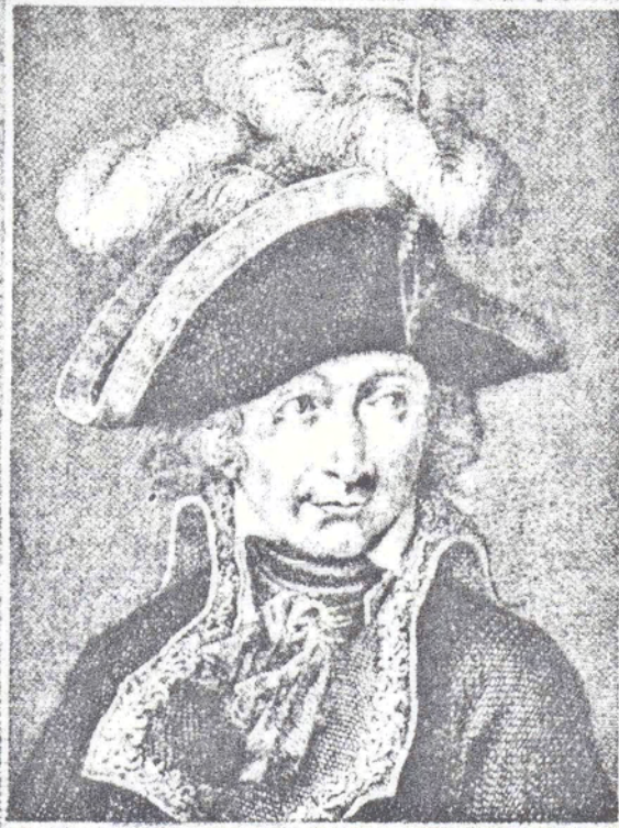
DE GENERAAL P I C H E G R U .